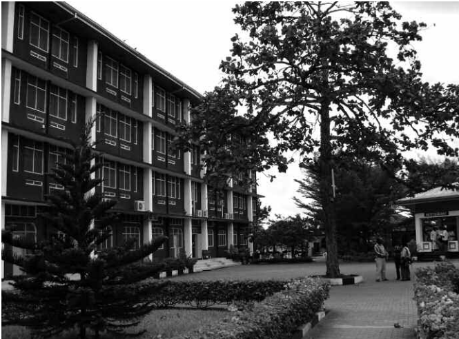
Dar es Salaam: Zentrum der katholischen Bischofskonferenz

Auch bei den Muslimen existieren unterschiedliche Gruppierungen. Die Mehrheit sind Sunniten, gefolgt von Schiiten. Neben ihnen gibt es Anhänger sehr viel kleinerer Gruppen, z. B. die Ahmadiyya und Ismaliya. Die Sunniten sind gewöhnlich friedfertige Muslime, was wahrscheinlich ein weiterer Grund dafür ist, dass in Tansania religiöse Unterschiede bisher keine besonderen Probleme darstellten. Einige Radikale suchen jedoch die Konfrontation zwischen Muslimen und Christen. Radikale Muslime haben sich zu Gruppen zusammengeschlossen, um überall im Land aktiv zu werden. Daraufhin haben radikale junge Christen ihren eigenen Verband, Biblia ni Jibu, gegründet, um sich auf dieselbe Weise zu betätigen. Die offiziellen Gremien beider Religionen verweigern Anhängern dieser Gruppierungen ihre Unterstützung, da sie Hass säen und Intoleranz unter ansonsten friedfertigen Glaubensanhängern propagieren.