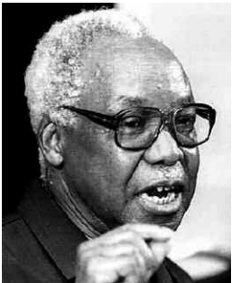
Julius Kambarage Nyerere

1975 räumte die Nationalversammlung der TANU eine legale Vormachtstellung ein, indem sie sie zur einzigen nationalen Partei erklärte. Nach der Gründung der CCM (1977), einem Zusammenschluss zwischen der TANU und der Afro-Shirazi-Partei (ASP), der die TANU stärken sollte, bildete Präsident Nyerere sein Kabinett um und bestimmte mit Edward Moringe Sokoine einen unermüdlichen Gefolgsmann für das Amt des Premierministers (1977–1980). 1980 wurde Präsident Nyerere mit überzeugender Mehrheit wiedergewählt.