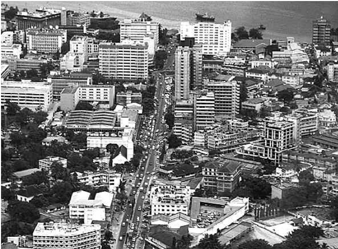
Dar es Salaam