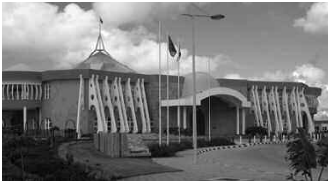
Parlament in Dodoma

Gemeinschaft ostafrikanischer Länder. Nach deren Ende brauchte es viele Jahre, um die Aktiva und Passiva untereinander aufzuteilen. Im Westen Tansanias liegen Burundi und Ruanda, zwei Länder mit einer traurigen Geschichte. In beiden Ländern streiten sich Hutu und Tutsi um die Vorherrschaft. Im Frühjahr 1973 – nach 342 Stammesmassakern – waren die politischen Beziehungen mit Burundi sehr gespannt. Die Massaker trieben viele Menschen aus dem Land, ließen sie in Massen in Tansania Zuflucht suchen und führten an der Grenze zu offenen Kämpfen zwischen tansanischen und burundischen Truppen. Weitere Flüchtlingsströme kamen nach dem Genozid in Ruanda (1994) und dem Bürgerkrieg im damaligen Zaire (1996) ins Land. Inzwischen herrscht Frieden, und die Zeit ließ die Wunden verheilen. Deshalb wurden 1983 die Grenzen zu Kenia wieder geöffnet. Die politischen und wirtschaftlichen Beziehungen mit Uganda haben sich unter der Präsidentschaft des seit Januar 1986 amtierenden Yoweri Kaguta Museveni verbessert. Die Gemeinschaft ostafrikanischer Länder ist teilweise zu neuem Leben erwacht. Ihr parlamentarischer Sitz und ihre Zentrale befinden sich im tansanischen Arusha. Darüber hinaus träumen die drei Staaten jetzt von einer ostafrikanischen Föderation, die für das Jahr 2015 geplant ist.