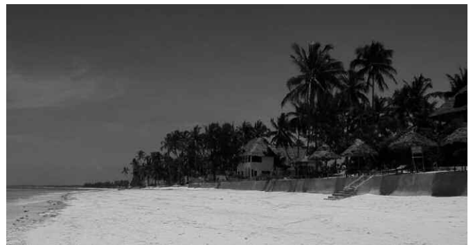
Sansibar ist ein Urlaubsparadies

Trotz der oben umrissenen wirtschaftlichen Probleme ist Tansania in vielerlei Hinsicht ein Modell für politische und gesellschaftliche Stabilität. Seit seinem Bestehen hat das Land nur sehr wenige Spannungen erlebt. Gegen die Präsidenten Julius Kambarage Nyerere und Ali Hassan Mwinyi gab es praktisch keinen Widerstand, und der Machtwechsel verläuft meist friedlich. Nur in Sansibar kam es aufgrund der eigenständigen Geschichte und Kultur zu einigen ernsthaften politischen Unruhen. Die Insel hat weiterhin ihre eigene Regierung, geführt von einem Revolutionsrat, und einen Präsidenten, der zugleich Tansanias Vizepräsident ist. Darüber hinaus erhält Sansibar einen Teil der Staatseinkünfte aus dem Erlös von Bodenschätzen, die vor allem auf dem tansanischen Festland zu finden sind.