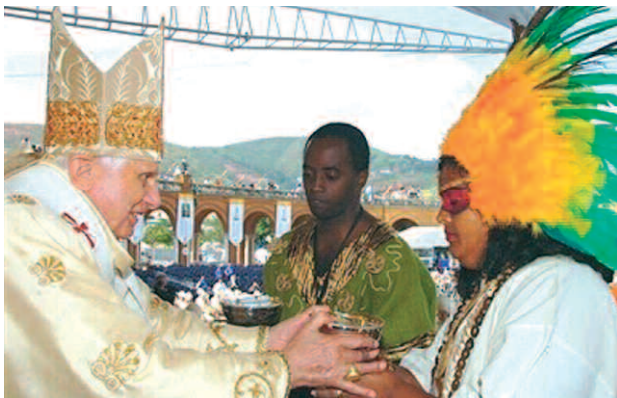
Messe à Aparecida : le Pape Benoît XVI parle avec des représentants des peuples indigènes

Par conséquent, il est nécessaire et urgent de proposer la Parole de Dieu aux croyants comme un don du Père, qui rend possible une rencontre avec le Christ vivant et, par là même, ouvre à une conversion authentique et à un renouvellement du sens de la communauté et de la solidarité. Cette proposition ne