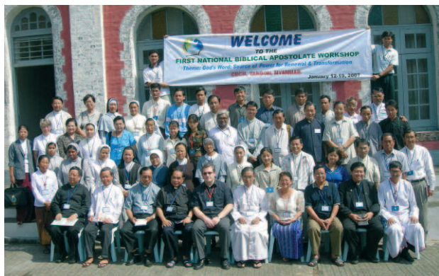
Participants de la Première Rencontre nationale de pastorale biblique