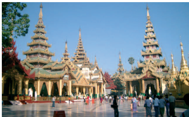
La pagode de Shwedagon à Yangon

Dans le domaine économique, le pays est exposé également à de grands défis. Alors qu'un quart de la population doit survivre avec moins d'un dollar US par jour, l'État dépense des sommes exorbitantes (50% des revenus de l'État) pour les services secrets, la police et l'armée.