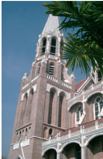
La cathédrale catholique de Yangon

à 25 ans, parmi lesquels 9 jeunes hommes. Dans d'autres diocèses, la proportion hommes-femmes est inverse. La formation se fait sous forme d'un cours de deux ans qui implique une présence du mois de juin au mois de décembre. Dans l'école de catéchistes de Yangon, des laïcs (catéchistes), des religieuses et des prêtres enseignent l'Ancien