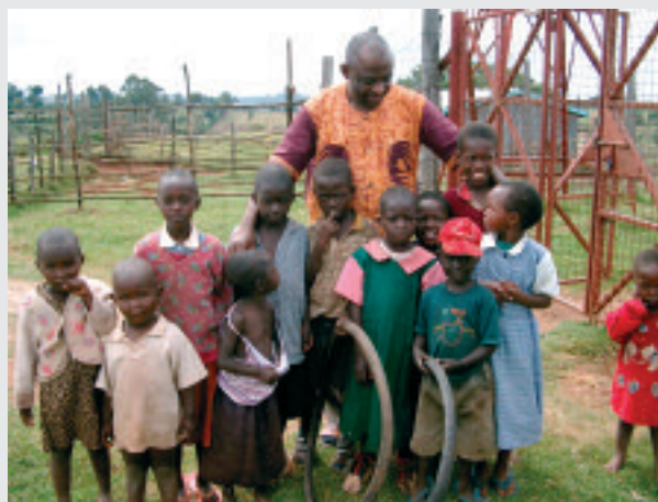
Les enfants sont l'avenir de l'Afrique