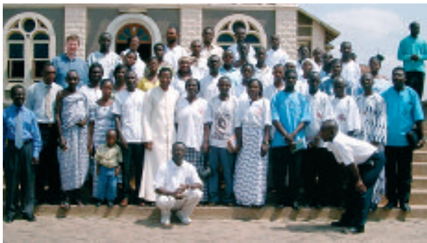
Le P. Gabriel et son équipe, avec des participants au cours de formation

Rythmes scandés et tambours frappés, chants polyphoniques et danses colorées, célébrants entrant en procession au battement de la musique et intronisation solennelle de la Bible devant l'autel – c'est dans un tel déploiement sonore que commence la messe festive en l'église Sainte-Marie de Kumasi, deuxième plus grande ville du Ghana. Cette messe, présidée par l'archevêque, Mgr Peter Kwasi Sarpong, se déroulera durant plus de deux heures et sera suivie d'une cérémonie d'une durée presque équivalente, avec une assemblée de plus de 2000 fidèles venus de tout le diocèse : c'est le point central, aussi solennel que joyeux, d'une semaine de pastorale biblique célébrée dans tout le diocèse. C'est ainsi qu'est fêté le 25 e anniversaire de la pastorale biblique dans l'archidiocèse de Kumasi.