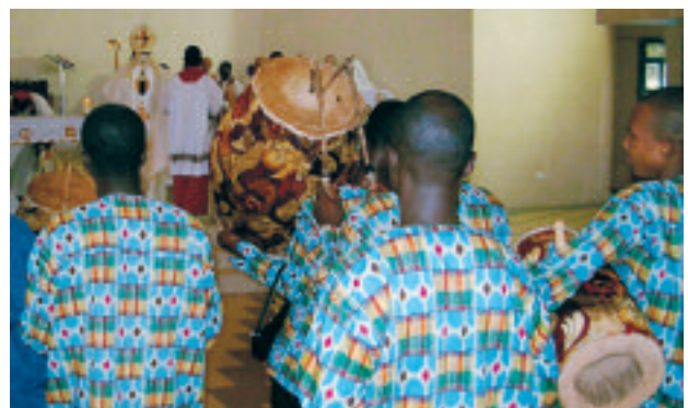
Tambour à la messe festive de Kumasi

Depuis sa conception, plus de trois cents hommes et femmes ont suivi ce programme et, pour cette seule année, cinquante-six nouveaux diplômés et diplômées seront à additionner au total ! C'est pour cela qu'une formation supplémentaire a été ajoutée il y a quelques années. Elle offre aux diplômés du cours fondamental la possibilité de se rencontrer une fois par mois pour échanger sur leurs expériences, approfondir leur connaissance de la Bible, ou bien accueillir de nouvelles idées et renouveler leur élan. Depuis longtemps maintenant, les participants ne viennent plus seulement de l'archidiocèse de Kumasi mais de tout le Ghana ; et beaucoup de communautés religieuses envoient leurs novices ou leurs postulants y suivre les cours.