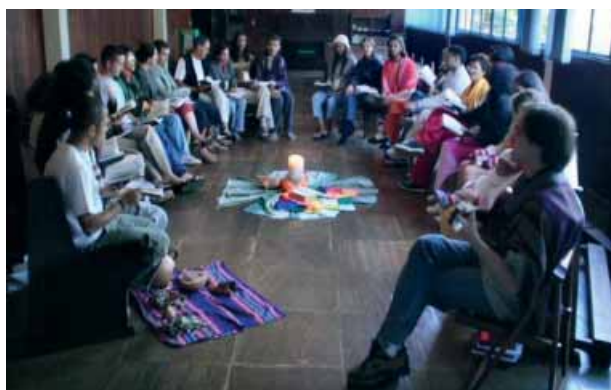
Cercle biblique dans un cours de Bible du CEBI au Brésil

Les activités du CEBI se déroulent généralement dans le cadre de groupes restreints, entre autres, dans les « écoles bibliques » présentes dans tous les États du Brésil. Ces groupes se retrouvent régulièrement pour étudier la Bible, faire face aux réalités quotidiennes, être ensemble et célébrer communautairement. Ils s'appuient autant sur leur foi que sur leur expérience. Beaucoup consignent leurs réflexions par écrit et les font circuler comme guides d'étude pour les autres groupes bibliques. Pour soutenir ce genre d'initiatives, le CEBI a mis en place un programme éditorial (utilisant ses propres presses). Ainsi ces matériaux peuvent-ils être accessibles à tous, tant au niveau du contenu que du prix.