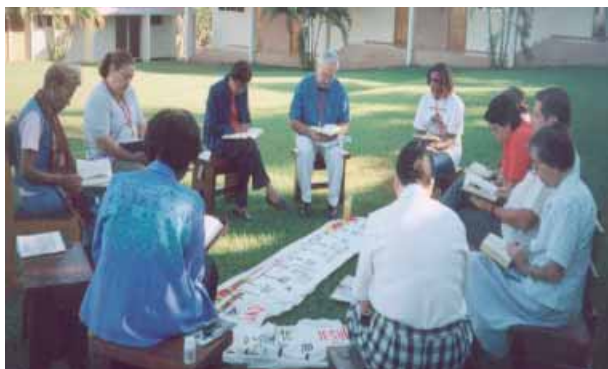
Partage de Bible. Lire la Parole à la lumière de sa propre vie

fête de saint Jérôme, grand bibliste interreligieux – car il réalisa sa Vulgate avec l'aide des rabbins de son époque – nous fournit une date pour cette célébration de prière biblique. Le texte choisi fut la parabole du Samaritain, qui nous invite à mettre en œuvre la compassion. Au premier rang, en invités d'honneur, étaient présents un groupe de chrétiens sourds, des malades du sida, des cancéreux et des mères célibataires : humble signe de notre humanité tombée au bord des chemins d'aujourd'hui, qui va recevoir de la Parole la force pour se lever et vivre. Ils nous ont offert les roses que nous avons échangées au moment du salut final : « La paix soit avec toi. Soyons proches de nos frères et sœurs ! »