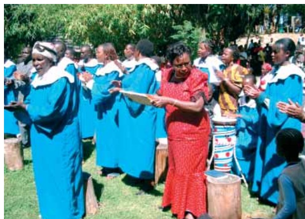
Célébrer la Parole : un service d'Église

Au Ghana, trente participants ont suivi ce cours, dont un nombre important de femmes et de laïcs